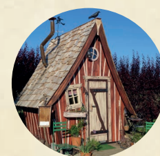
Das zauberhafte Syringa-Märchenhaus im Duftgarten